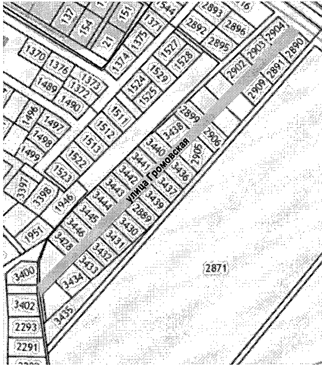
Схема элементов улично-дорожной сети в микрорайоне Водиом деревни Медвенка муниципального образования город Тула