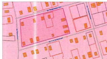
Экспликация образуемых и уточняемых земельных участков