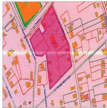
Экспликация образуемых и уточняемых земельныхучастков